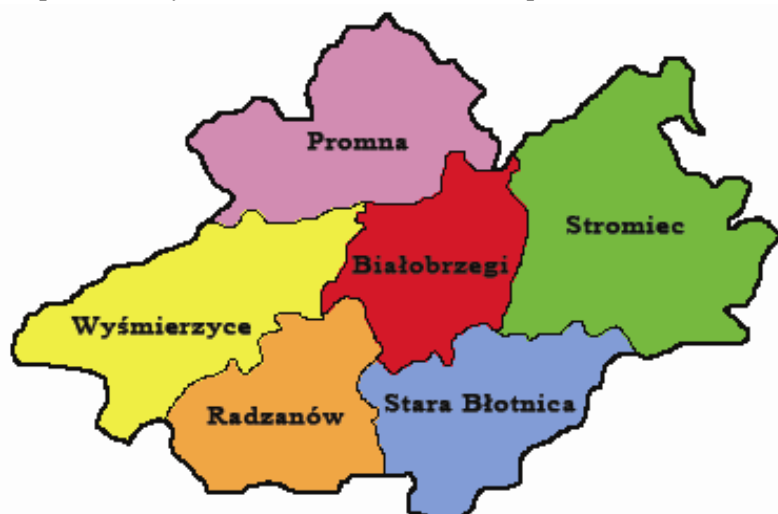
Mapa 1. Gminy wchodzące w skład LGD Zapilicze